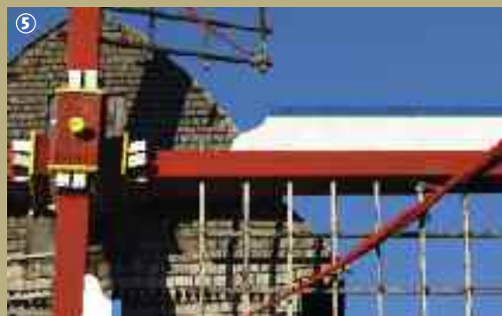
Casteel meulen à Cassel

Aujourd'hui une vingtaine de moulins à vent subsistent dans le Nord, alors qu'on en recensait 2000 au XIX e siècle. La plupart sont visitables, selon conditions, et font revivre les savoir-faire d'autrefois.