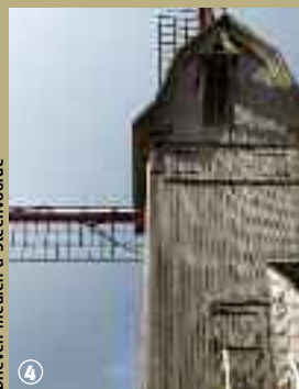
Drieven meulen à Steenvoorde

composent d'un piédestal fixe supportant une cage qui pivote, afin de placer les ailes face au vent. Les moulins à pivot sont composés de deux greniers : celui du haut abrite les meules ; celui du bas s'occupe de réceptionner la farine et gère les opérations de blutage c'est-à-dire de séparation du son de la farine et d'aplatissement de