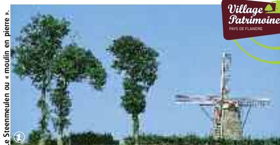
Le Steenmeulen ou « moulin en pierre ».