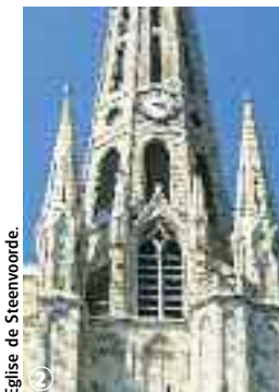
Eglise de Steenvoorde.