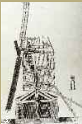
Moulin à vent.

Avant les bouleversements de la Révolution industrielle, les moulins étaient pratiquement les seuls producteurs d'énergie. Ils servaient principalement à broyer les céréales et à la fabrication de l'huile. La Flandre, qui bénéficiait du souffle des vents dominants de secteur ouest, fut la terre des moulins à vent. Ils faisaient partie intégrante du paysage, au même titre que les églises. Pour la plupart, il s'agissait de moulins sur pivot. D'une manière générale, ils se